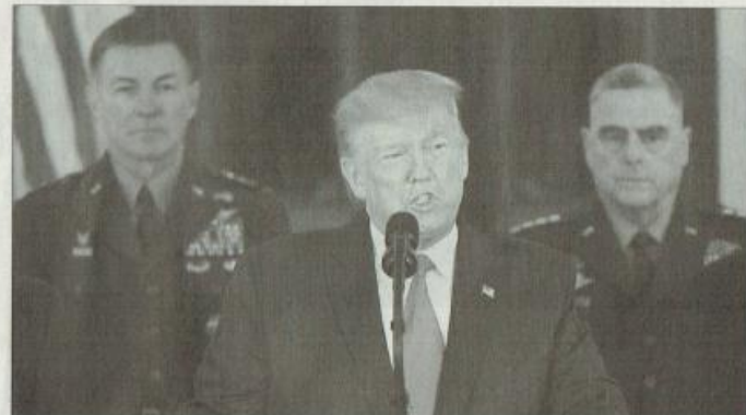
当地时间10月8日的讲话中，特朗普

但特朗普也软化，已经有所退让，这对世界来说也是好事。他喊话，表示美国希望伊也准备好与任何寻求和平的伊朗领导人对话。当地时间1月3日，美国国务院发布声明，巴格达国际机场附近发生爆炸，造成多人伤亡。特朗普在讲话中并未表示一定要动用武力，美国