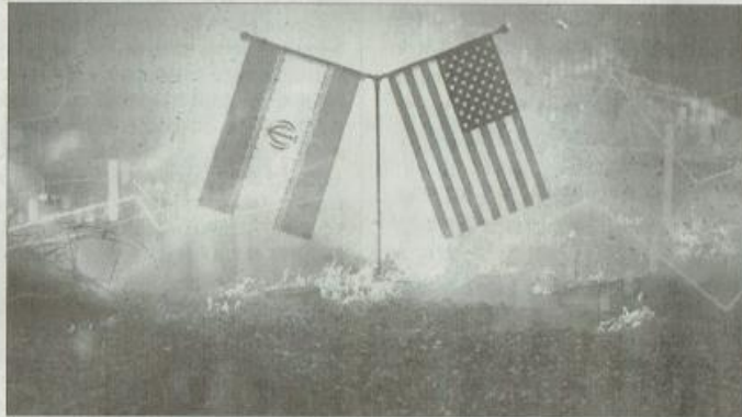
美国将立即对伊朗政权施加额外的惩罚性经济制裁，直到伊朗

但特朗普也软化，已经有所退让，这对世界来说也是好事。他喊话，表示美国希望伊也准备好与任何寻求和平的伊朗领导人对话。当地时间1月3日，美国国务院发布声明，巴格达国际机场附近发生爆炸，造成多人伤亡。特朗普在讲话中并未表示一定要动用武力，美国